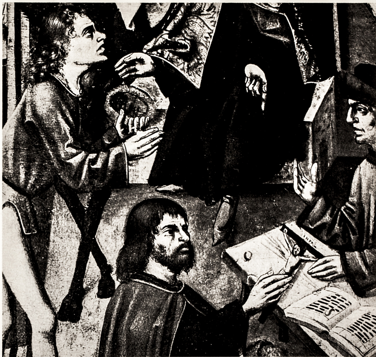
«Non giurare!» (partic. dalla "Tavola dei 10 comandamenti" di Danzica).

Ascolta con timore, Israele, / il [tuo] Dio che tuona al monte Sinai: / rispetta la Sua santa legge / che Egli dispensò dalla Sua bocca. // «Io sono — disse — il tuo Dio supre- mo, / che, stendendo il suo braccio per te, ti liberò dal giogo estremo: / non avrai altro Dio all'infuori di Me». «Non ti farai alcuna immagine, / Io sono un Dio potente e gelo- so; / non le renderai omaggio, / altrimenti sentirai il mio sdegno». // «Non giurare tem- erariamente / nel sacro nome del Signore, / perché Egli si mostrerà severo / verso chi si servirà impropriamente del Suo nome». // «Lavora sei giorni e il settimo / osserva il ri- poso del Signore, / ricordandoti che in quello stesso giorno / il Creatore si riposò». // «Onora il padre e la madre / e Dio prolungherà i tuoi anni / sulla terra che Egli ha pro- messo / ai suoi figli come ricompensa». // «Non ammazzare e non offendere alcuno; / evita con cura ogni lussuria; / non dedicarti a ruberie; / non essere bugiardo né falso te- stimone». // «Non desiderar nell'animo / la casa o il campo altrui, / il suo bue, il suo schiavo o la sua donna, / né null'altro di suo». // «Ama Dio di un amore supremo / con timore, rispetto e fede; / e [ama] il tuo prossimo come te stesso: / questo è il sommario della Legge». // Gran Dio, la Tua parola efficace / ci converta tutti a Te; / che Tu voglia farcì la grazia / di servirti secondo la Tua Legge.