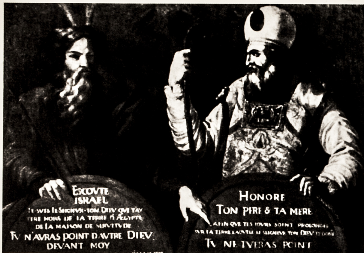
Testo pubblicato in R. BALMA - A.G. RIBET, Vecchie canzoni della nostra terra , Pinerolo, Unitipografica Pinerolese, 1930.

4. «Ne jure point en téméraire Le sacré nom du Souverain; Car Il se montrera sévère A qui prendra Son nom en vain».