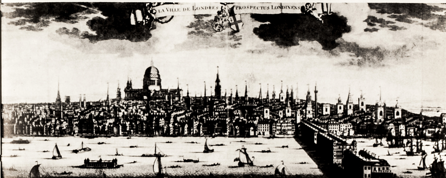
Londra nel 1714.

Testo pubblicato in R. BALMA - A.G. RIBET, Vecchie canzoni della nostra terra , Pinerolo, Unitipografica Pinerolese, 1930.