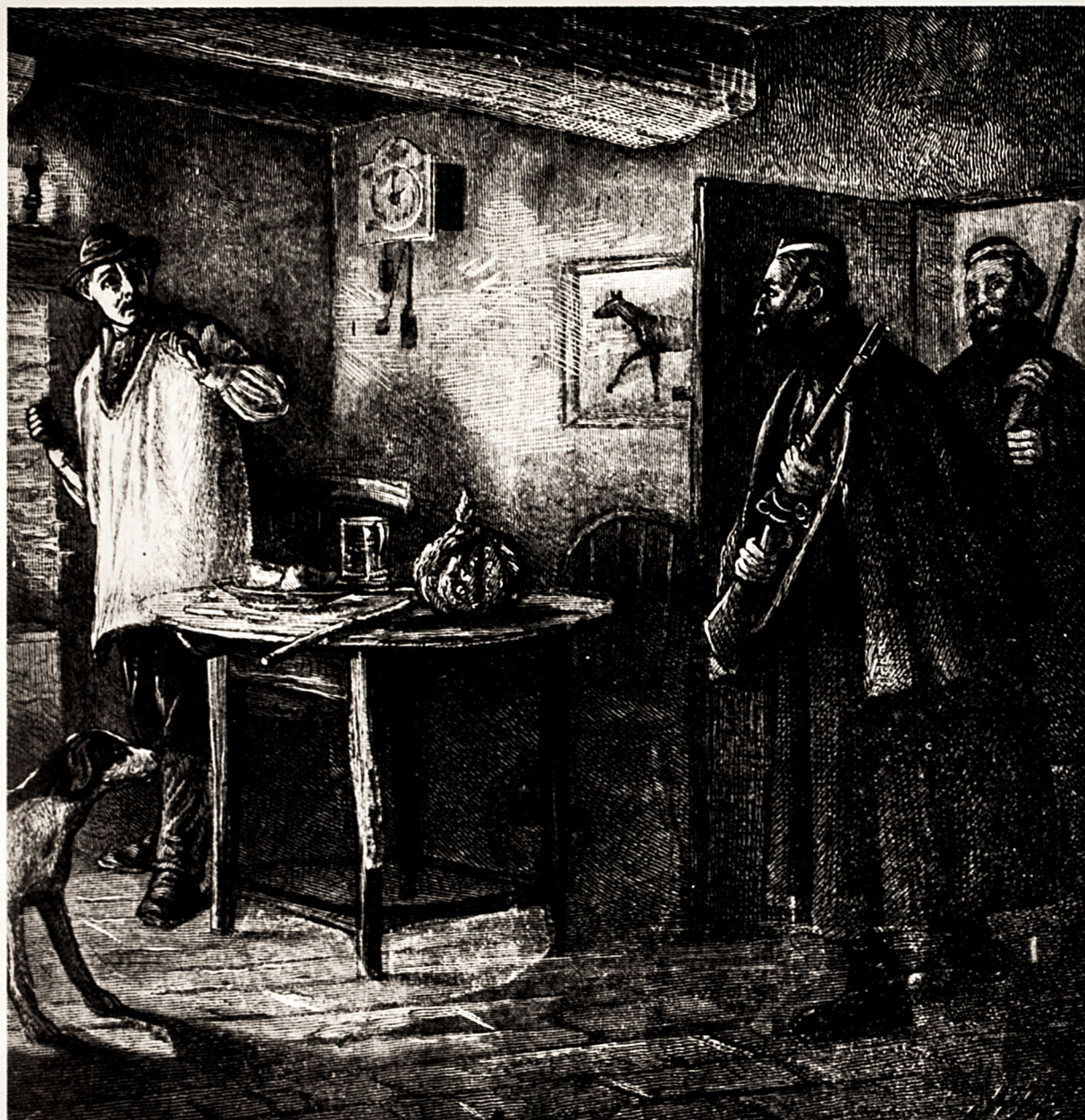
L'arresto di un ladro.

Quand j'ai été sur la potence — j'ai regardé la France: J'ai vu mes compagnons — à l'ombre d'un buisson.