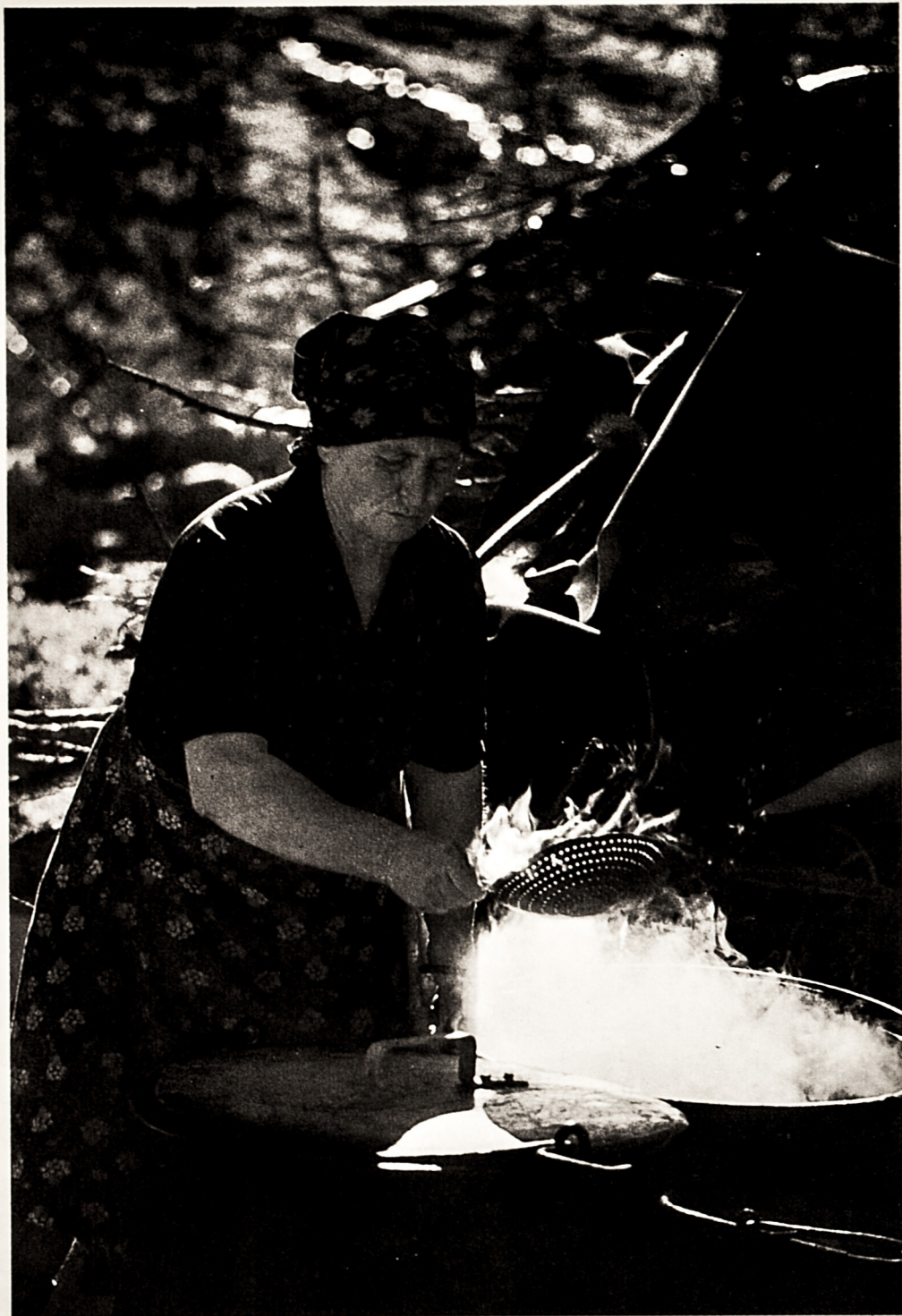
La preparazione del caglio per il formaggio.

Era una pastorella /.../ che sorvegliava le sue pecore. ... // Lei fece un formaggio /.../ dal latte delle sue pecore... // È il gatto che la osserva /.../ con uno sguardo birichino... / «Se vi metti la zampa dentro /.../ assaggerai il bastone». // Il gatto non vi mise dentro la zampa /.../ ci mise il muso... // La pastorella arrabbiata /.../ ammazza il suo gatto... // Lei andò dal padre /.../ a chiedere perdono... // «Padre, io mi accuso /.../ di avere ucciso Raton». // «Figlia mia, per penitenza /.../ ci abbracceremo...». // «La penitenza è dolce /.../ ricominceremo da capo...».