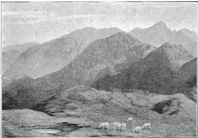
G. B. GALIZZI: L'ALBEN