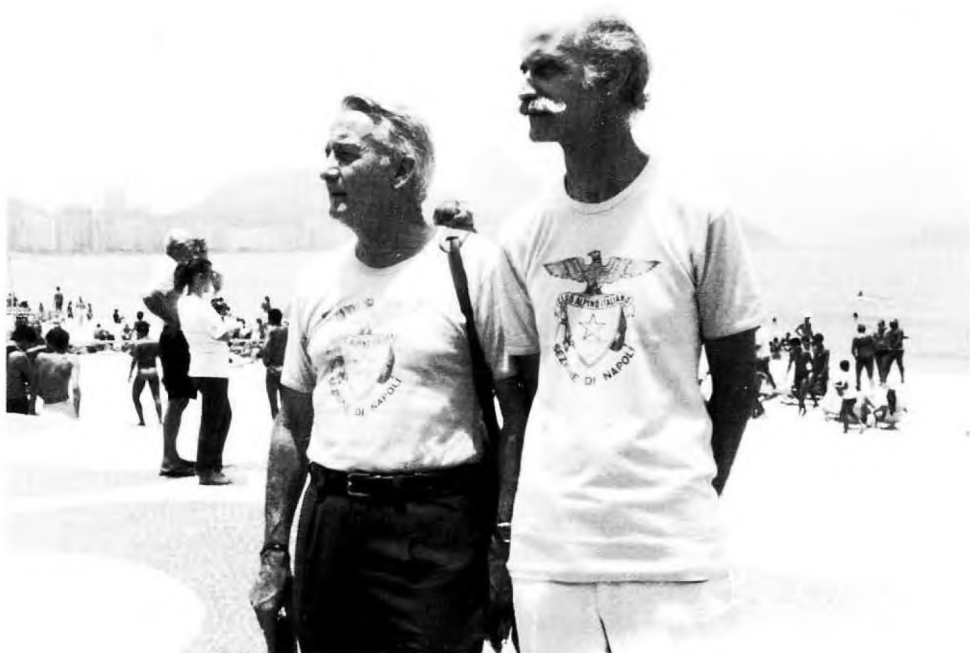
I consoci Luchini a Buenos Aires con la Sezione nel cuore

La Sezione di Napoli da un Continente all'altro ..... Dal Kilimanjaro ..... al Pan di Zucchero!