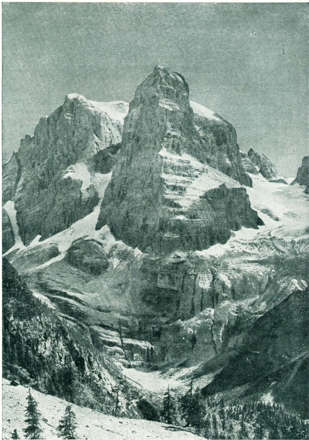
Gruppo di Brenta - Il Crozzon di Brenta da Grasso d'Overo.