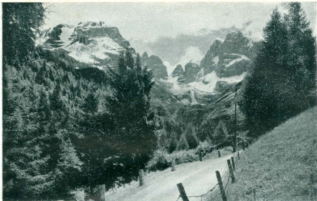
La strada presso Madonna di Campiglio.