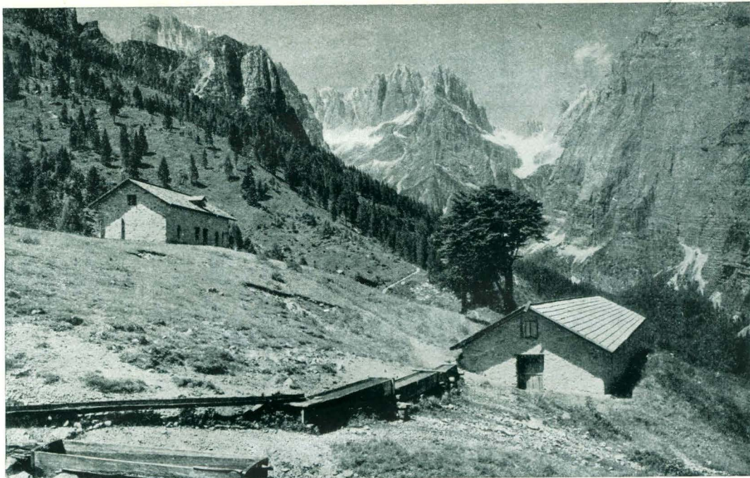
Malga Audalo presso Molveno.