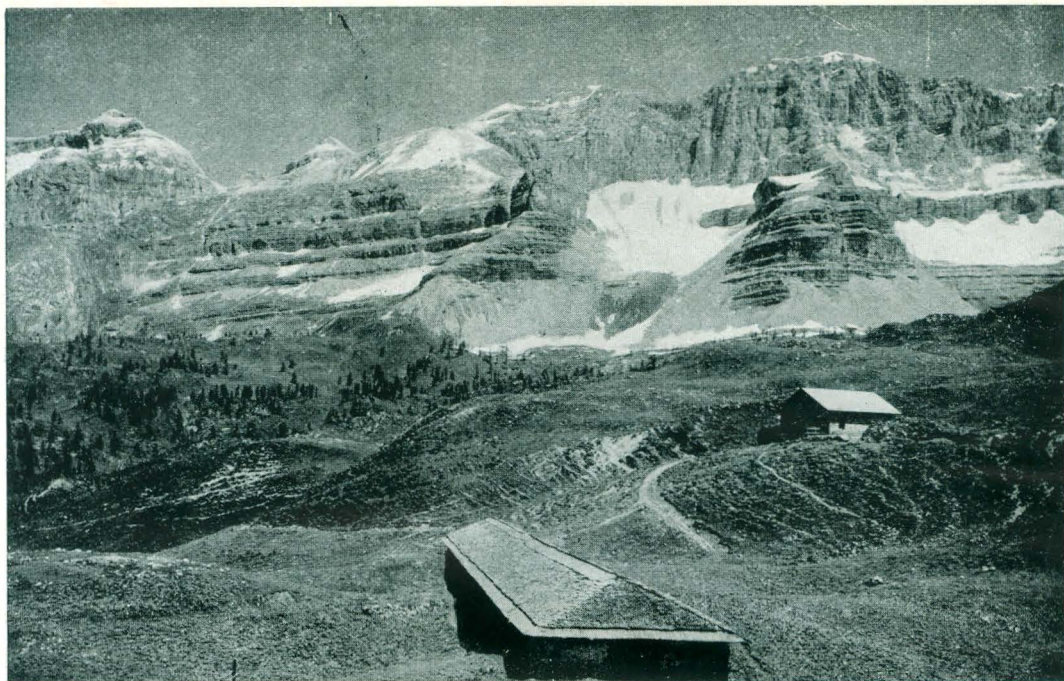
Madonna di Campiglio - Majga ai Boc verso Pietra Grande.

Sono utili gli occhiali, e per evitare fastidiose bruciature la crema protettiva. Indispensabilissimi i peduli.