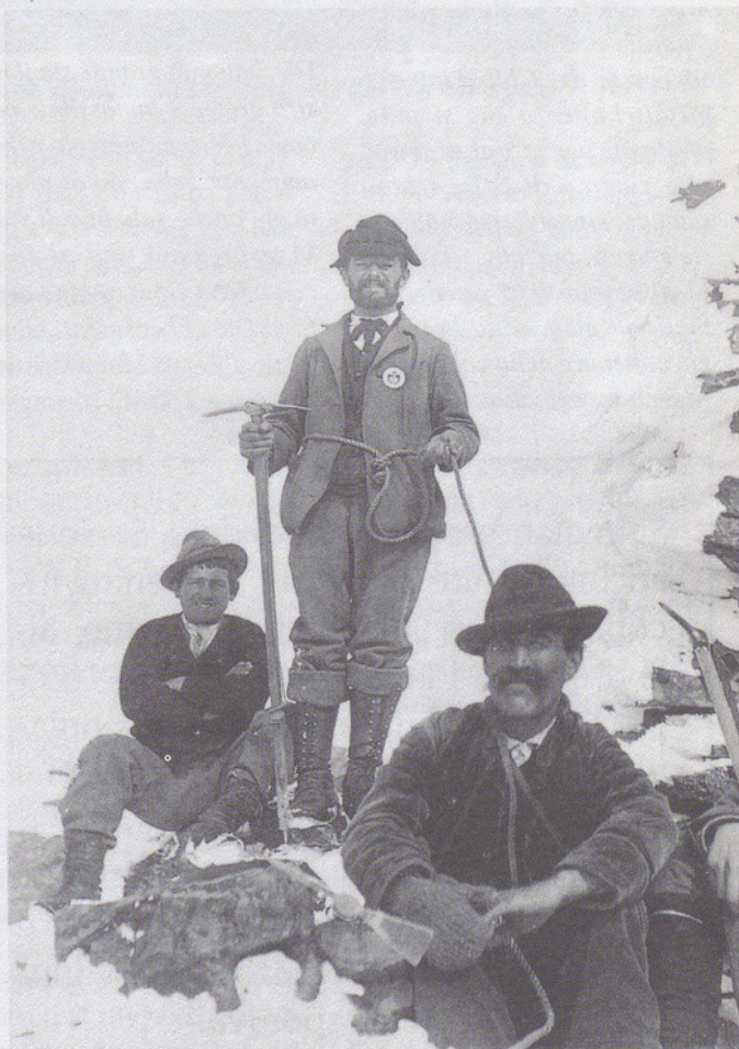
Gruppo di alpinisti sulla cima del Monviso.