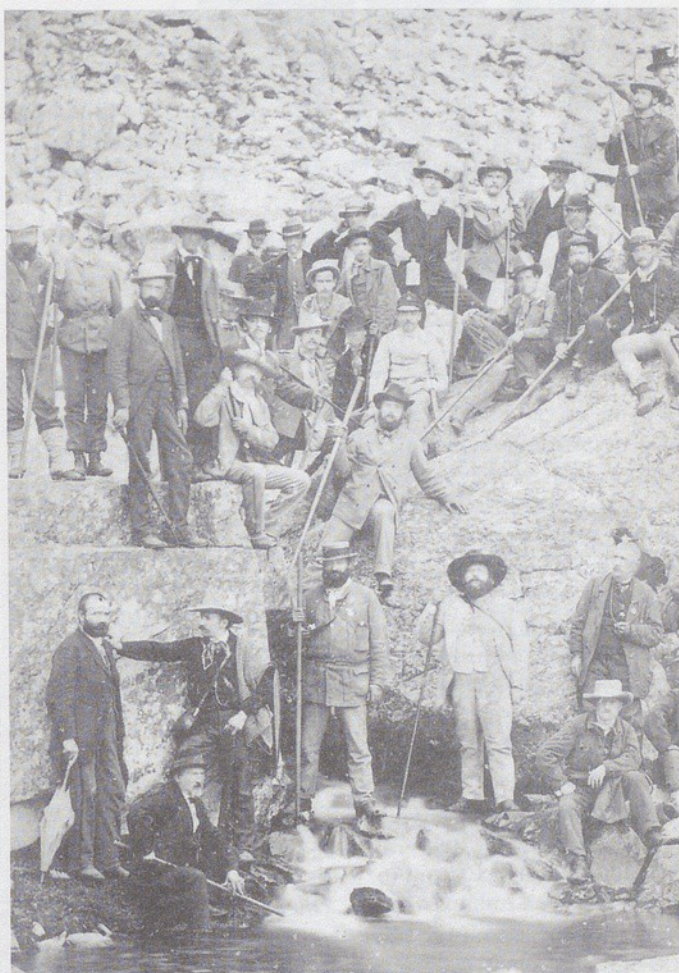
Raduno di alpinisti alle sorgenti del Po, 1883.

La situazione di stallo sembra essersi sbloccata, dopo che il complesso del Monte dei Cappuccini è passato dalla Ripartizione Lavori Pubblici del Comune di Torino, all'Assessorato ai Beni Culturali, organismo quest'ultimo più snello.