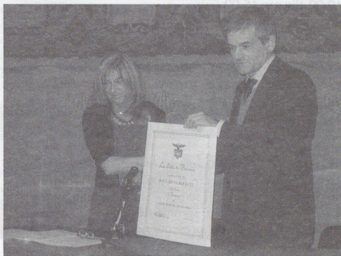
La presentazione della Giornata; la targa vicino all'ingresso del Centro Incontri; la targa all'inizio della strada; il Sindaco riceve il diploma di associazione benemerita della Città al CAI Torino.