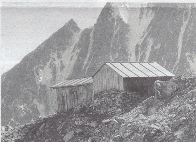
Il vecchio rif. "Gonella"

successiva di alcuni decenni, ma oggi appare più che mai significativa per collocare nella cornice della storia alpinistica l'antica struttura d'accoglienza. E soprattutto ci riporta ad anni lontani quando, a causa delle condizioni della viabilità e dei trasporti, la frequentazione del Monte Bianco richiedeva impegnativi viaggi di avvicinamento e imponeva agli scalatori la disponibilità ai lunghi soggiorni. Davvero tutta un'altra storia rispetto alle ascensioni del nostro tempo, consumate nel-