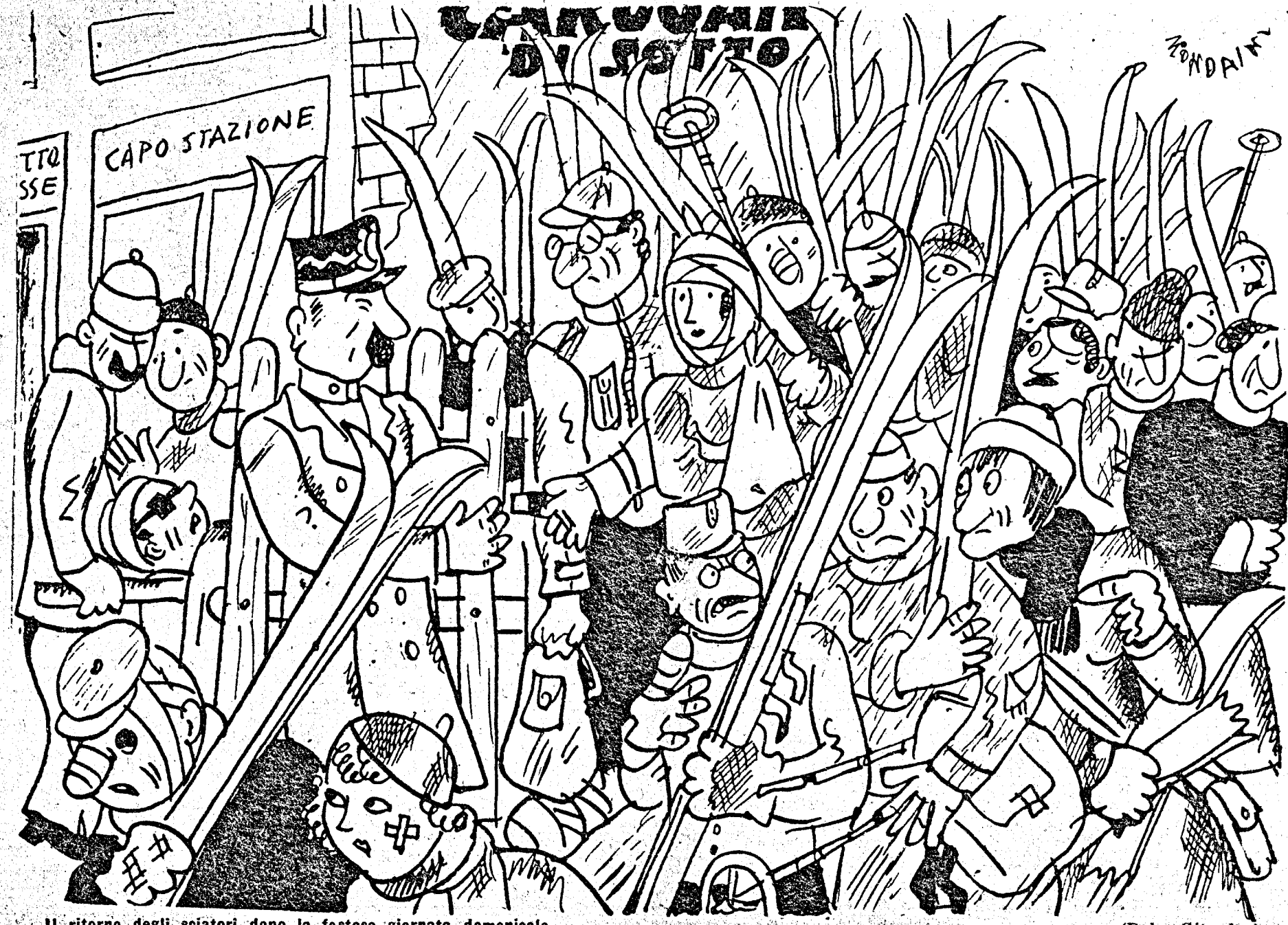
Il ritorno degli sciatori dopo la festosa giornata domenicale.