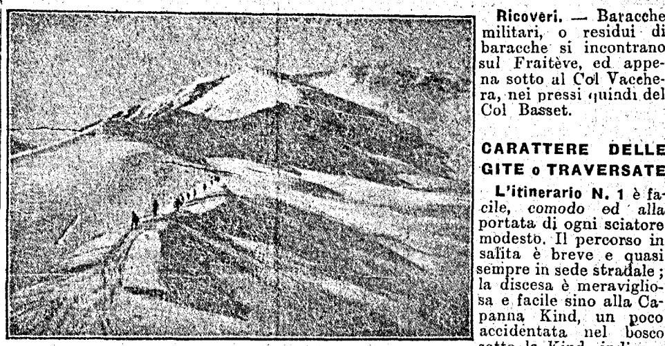
La cresta N. E. del Fraiteve

Molte volte a Milano ci domandiamo dove si potrebbe andare a sciarare lungamente, mancando la neve nelle vicinanze e non potendo disporre che della sera del sabato e della giornata domenicale. Non troviamo risposta alla nostra domanda, perché la nostra mente non corre subito ai meravigliosi campi di Val di Susa, ai quali si può arrivare in tante ore, quando ne occorrono per raggiungere, ad esempio, un alto Rifugio di Valsassina, come avviene nel Rif. Grassi, Rif. Castelli, Rif. Lecco.