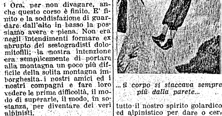
Il corpo si staccava sempre più dalla parete...