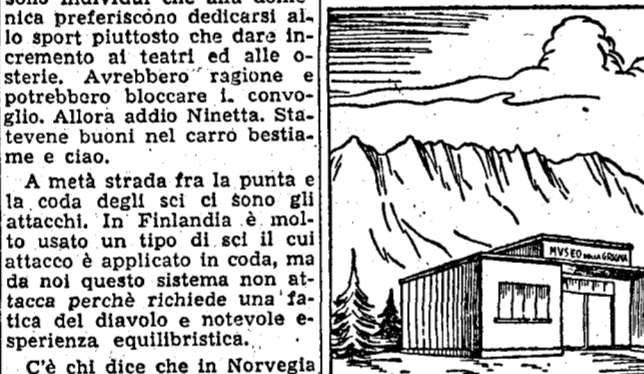
Il Museo della Grigna.