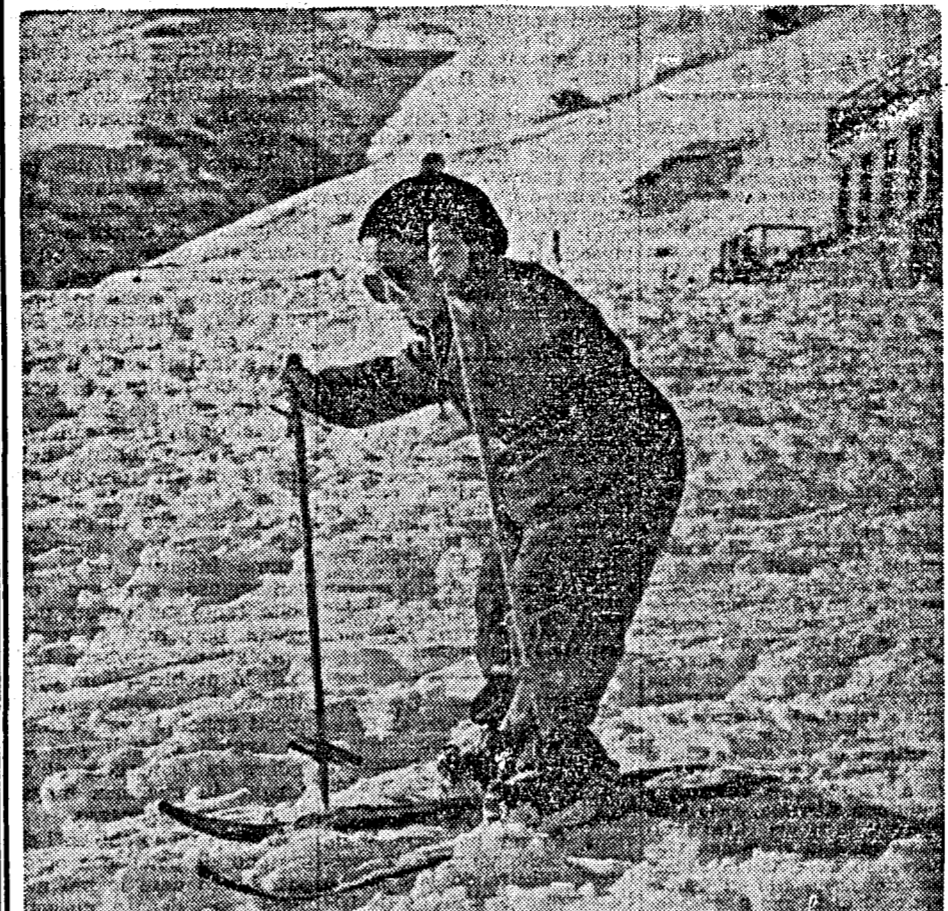
Primi passi del "marmocchio", sulla neve. E' un auto-didatto; vuol fare senza maestro. Forse è il sistema migliore...