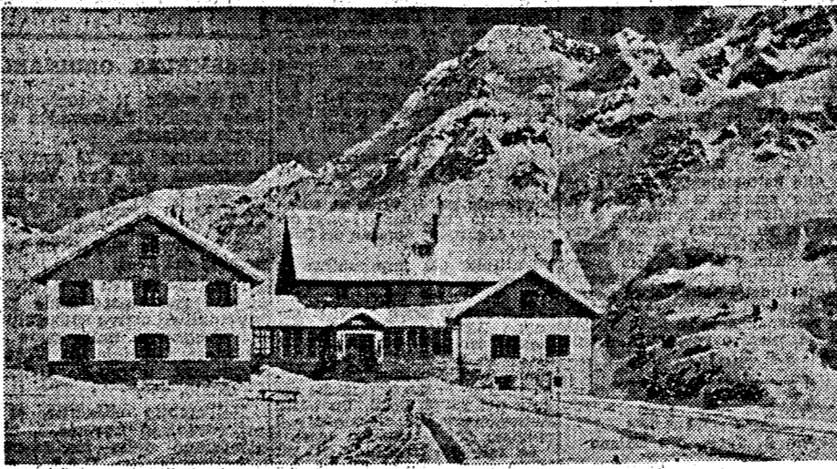
Per lo sci primaverile: il Rifugio Nino Corsi del C.A.I. Milano, sotto il Cevadale, nell'Alta Val Martello (m. 2265) (accesso Val Venosta, Merano), al centro di suggestive e non difficili traversate ed ascensioni.