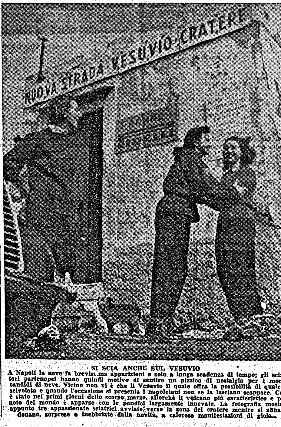
SI SCIA ANCHE SUL VESUVIO A Napoli la neve fa brevis ma apparizioni e solo a lunga scadenza di tempo; gli sciatori partenopei hanno quindi motivo di sentire un pizzico di nostalgia per i monti candidi di neve. Vicino non vi è che il Vesuvio il quale offre la possibilità di qualche sciolata e quando l'occasione si presenta i napoletani non se la lasciano scappare. Così è stato nei primi giorni dello scorso marzo, allorché il vulcano più caratteristico e più noto del mondo è apparso con le pendici largamente innevate. La fotografia mostra appunto tre appassionati sciatori avviate verso la zona del cratere mentre si abbandonano, sorprese e inebriati dalla novità, a calorose manifestazioni di gioia.

Strappi e dolori muscolari sono conseguenze frequenti di una assidua attività sportiva. Applicare esternamente il famoso Linimento SLOAN sulla parte dolente. Ben presto avvertirete un benefico senso di calore che penetra in profondità e che, a poco a poco, lenisce il dolore.