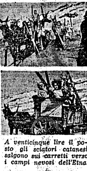
A venticinqué lire il posto gli sciatori canadesi salgono sui carretti verso i campi nevosi dell'Etna.