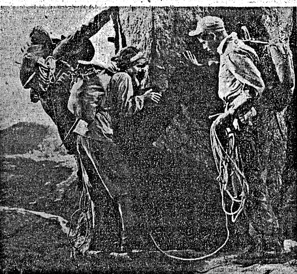
Una scena del film EKO in technicolor «La Torre Bianca» con Alida Valli, Glenn Ford e Claude Rains. Girato dal vero sulle Alpi nel pressi di Chamonal mette nella più vivida luce le bellezze della montagna e l'audacia degli scalatori.