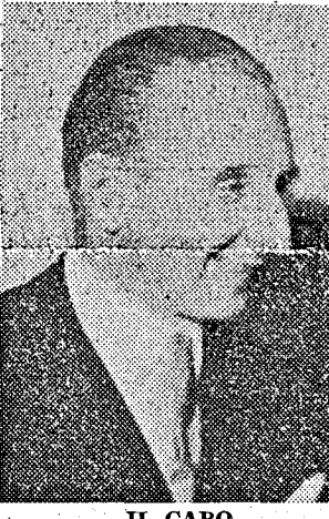
IL CAPO Prof. Ardito Desio