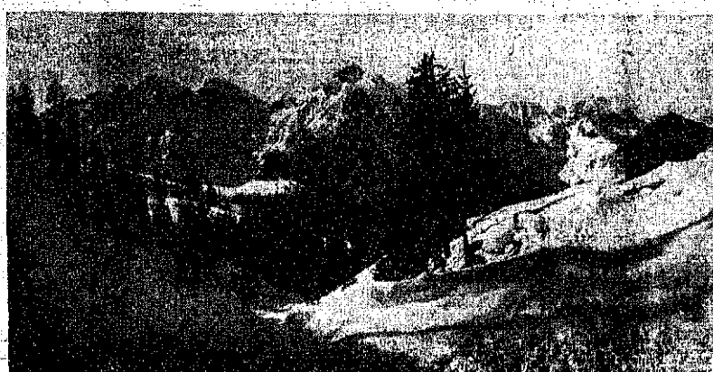
Una suggestiva visione della vallata e dei monti di Foppolo in veste invernale.

A 110 km. da Milano e a 1.600 metri d'altitudine, Foppolo, la montagna di casa del milanese, si sta a poco a poco abbellendo secondo l'ultima moda. Aumenta e si qualifica la ricettività: un nuovo albergo, l'Europa, aprirà a balconi l'altitudine stagionale, così come il funzionario "Mon Hotel", con annesso parcheggio macchine, bar e taverna, negozi. Nuove costruzioni stanno sorgendo e altre sono state progettate con linee moderne ed eleganti, ma il più importante è stato il completamento di un stabile-albergo nel quale è preordinato posto quanto prima un cinematografo, sale da gioco, night club e bar. Sarà presto possibile raggiungere in automobile il piazzale in cui tutti i turisti a buon punto i lavori della nuova strada che porta da Foppolo ai campi da sci; con brevissima percorrenza. Attualmente comunque è sempre a disposizione dei turisti la funivia che in 100" conduce alle seggiovie ed agli skilifts.