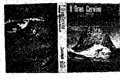
Il Gran Cervino