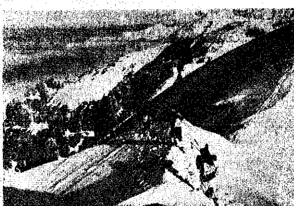
Una pattuglia scende dallo Zucone Campelli.

La perché abbiamo pure noi delle montagne interessanti e svariate volte conosciute, pare a Lecco il prossimo anno per il quarto rally. Il rally "Zucone" è organizzato dal C.A.I. di Lecco e si svolge sulle Funivie Lecco-Valsassina. Il rally è diviso in due parti: la prima parte è dedicata alla discesa e la seconda parte è dedicata all'ascesa. Il rally è aperto a tutti gli alpinisti e sciatori, sia italiani che stranieri.