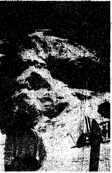
Quest'anno l'innnevamento particolarmente abbondante prolunga la stagione sci-alpinistica a tutto giugno.