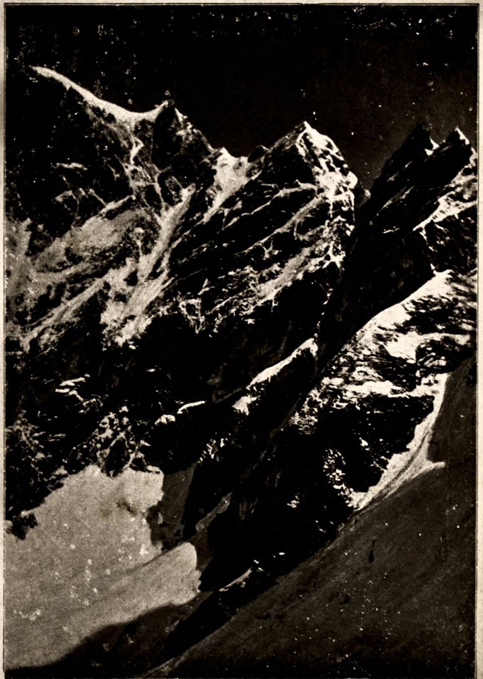
PUNTA BIANCA DAL GHIACCIAIO SUPERIORE DI CHÉRILLON.